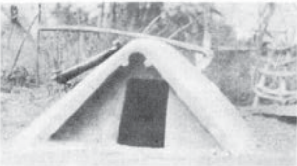
Beci din Stăncuța (Brăila)