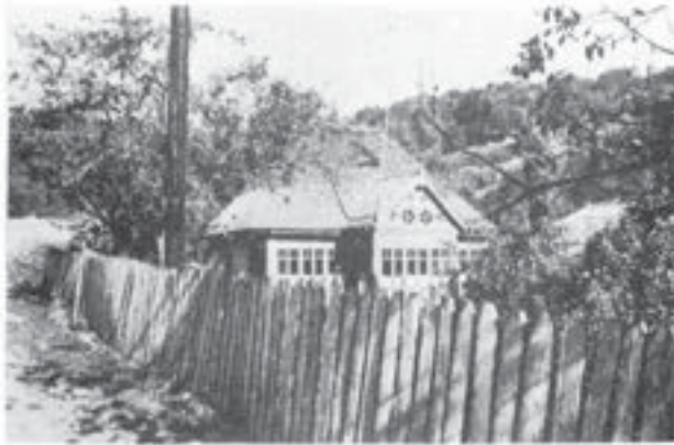
Casă din Siriu-Băi (Buzău)