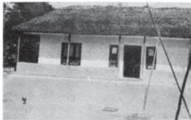
Casa informatorului Ștefan Năstase, Baldovinești (Brăila)