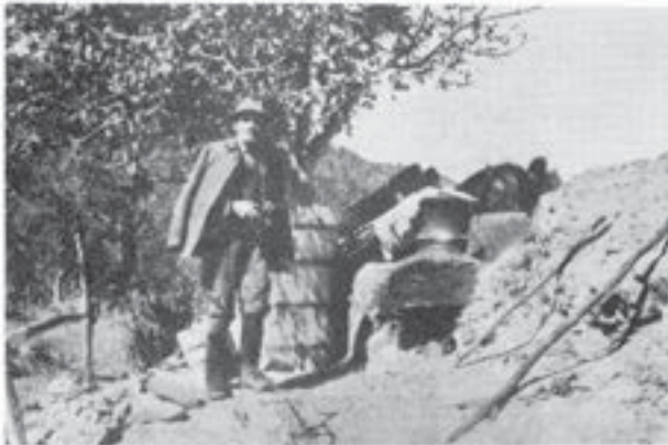
Cazan de țuică, Siriu-Băi (Buzău)