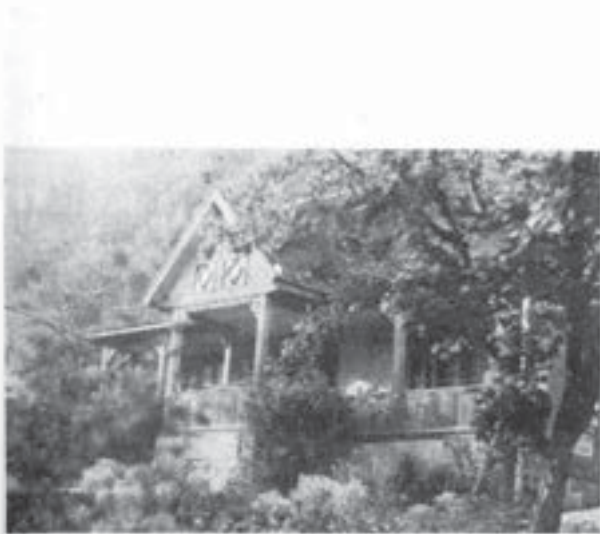
Casă din Nehoiiașu (Buzău)