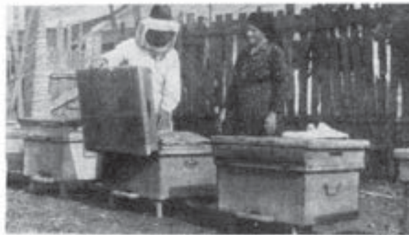
Apicultor din Viziru (Brăila)