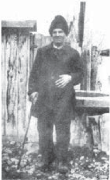
Vedeanu St. Marin, Lazuri (Dimbovița)