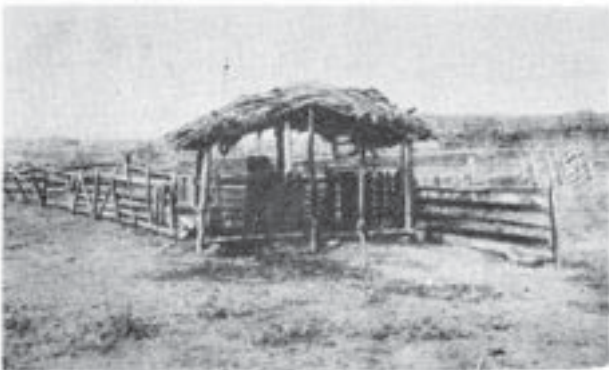
Stîna din Stăncuța (Brăila)