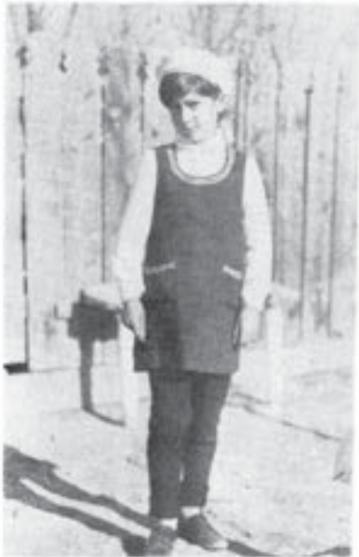
Băutu Sândița, Ariciu (Brăila)