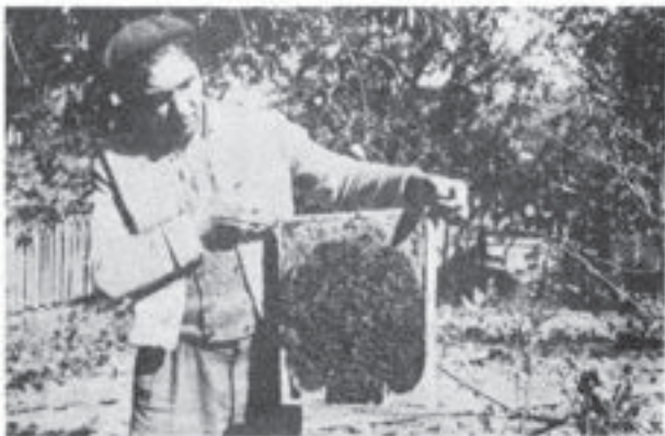
Borzoii S t . Nicolae, Gura-Teghii (Buzău)