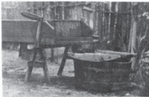
Lin din Gura-Sărățli (Buzău)