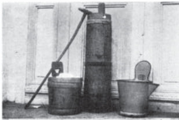
Putinei și cenace din Gologanu (Vrancea)